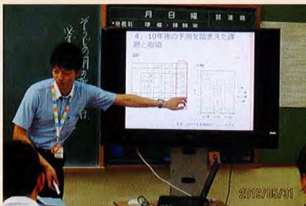
市の実情を統計資料を基に