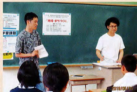
まちづくをエンクロスの方に