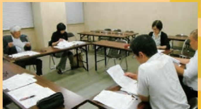
10月の交流会の様子

小中学校9年間を見通したキャリア教育、地域学校協働活動など、意見交換ができたらいと思います。ご参加を待っています。