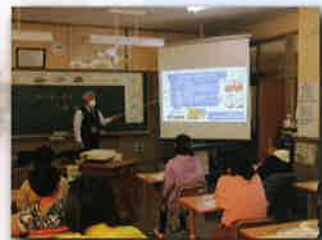
【実験や講話の様子】