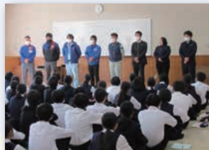
【全体会での講師の紹介】

恒富中学校の2年生(現3年生)が、地元で働く若手社員の方々に講話をしていただきました。子どもたちは、総合的な学習の時間で、社会人講話や地域企業訪問などの体験活動に取り組んでおり、今回はその一環として実施したものです。また、若手社員の方々にとっても、中学生に「働く喜びと苦勞」を本気で語ることで自らを振り返る機会となり、お互いに貴重な時間を共有できました。