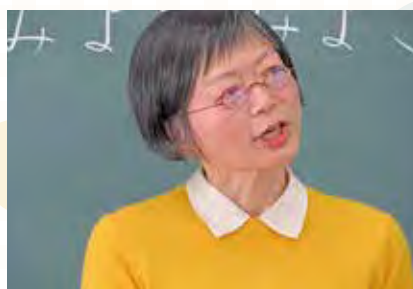
【みよこ みよこさん】