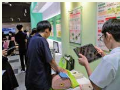
【旭化成展示センター】