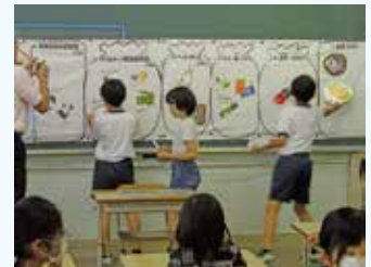
【分別について考える子どもたち】